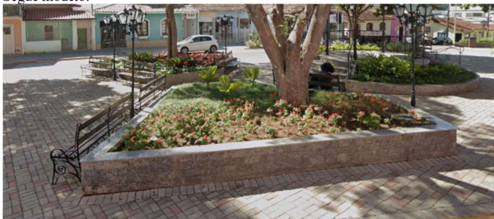
Modelo de canteiro de jardim com revestimento em pedra miracema e granito flameado