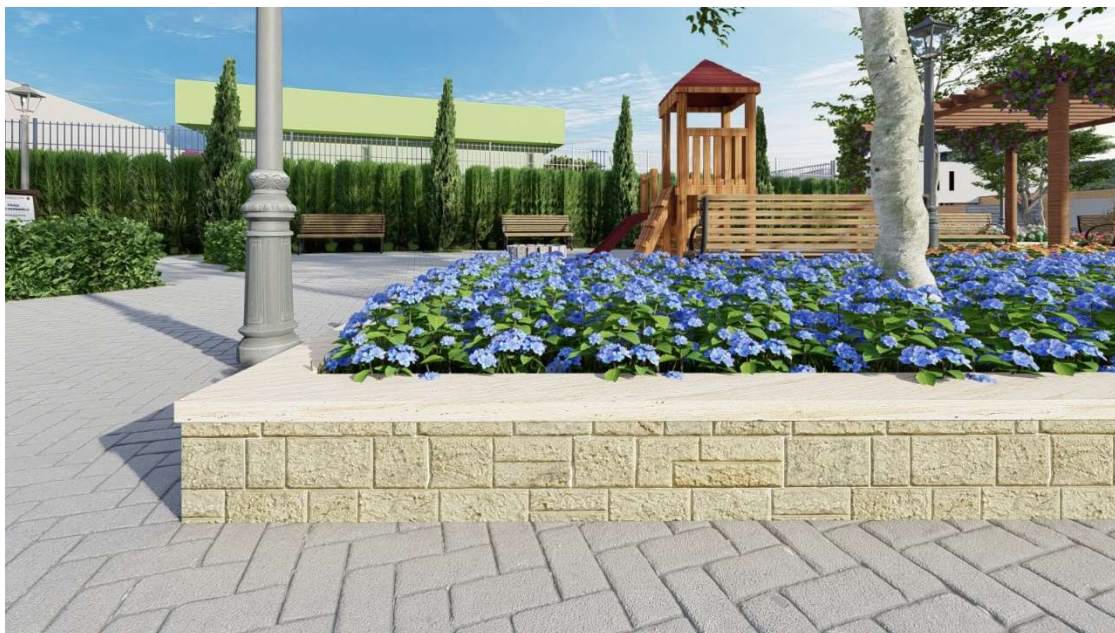
Perspectiva de canteiro de jardim com revestimento em pedra miracema e granito flameado