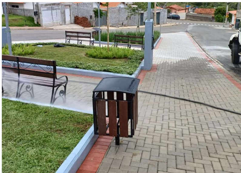
Modelo de Imobiliário para a Praça – Lixeiras

Lixeiras com estrutura em aço carbono, pintura preto fosco sintético, revestido de ecoblock slin, cesto de 38x55 cm, altura de 90cm.