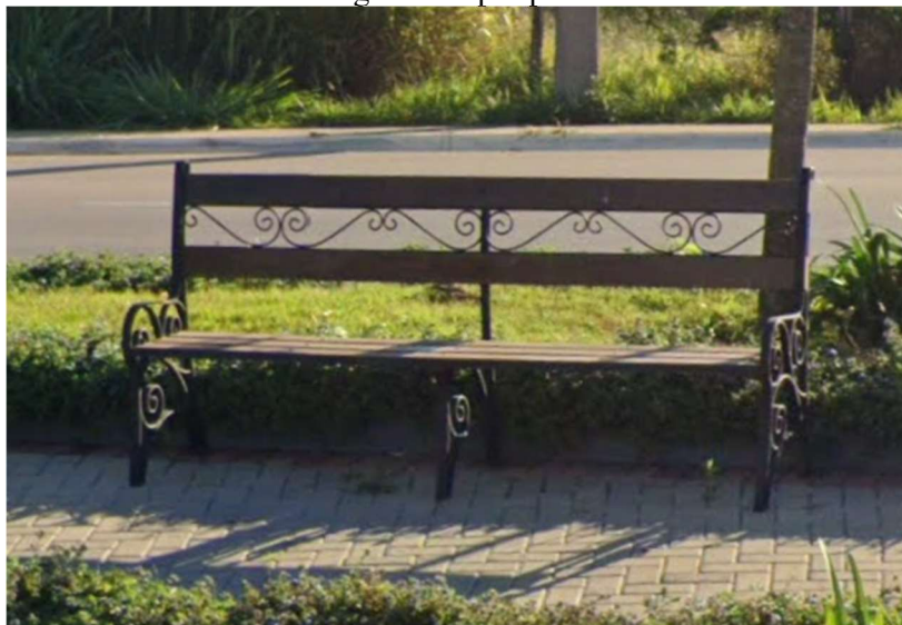
Modelo de Imobiliário para a Praça – Bancos

Poste Cônico Contínuo Curvo Duplo é fabricado em aço estrutural SAE 1010/1020, dobrado em prensa em formato de cone com solda longitudinal por processo automatizado.