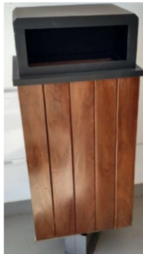
Mobiliários a serem instalados na praça do Morbidelli – Luminária, Banco e Lixeira

As imagens acima definem os mobiliários a serem instalados na praça do Morbidelli, sendo esses, 11 postes do tipo republicano com 1 globo, 13 bancos em serralheria artística e madeira, 6 lixeiras em estrutura metálica e madeira sucupira.