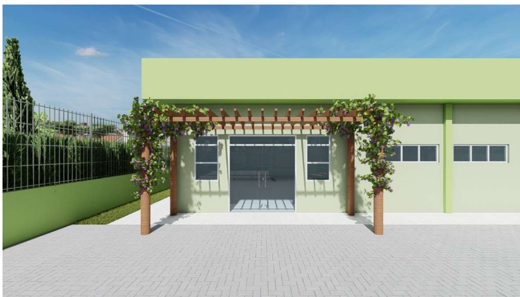
Modelo e Perspectiva de Pergolado em Madeira

Os parafusos que fixam a peça em aço carbono dos pilares serão em aço inoxidável; os demais parafusos, porcas e arruelas deverão ser em aço galvanizados.