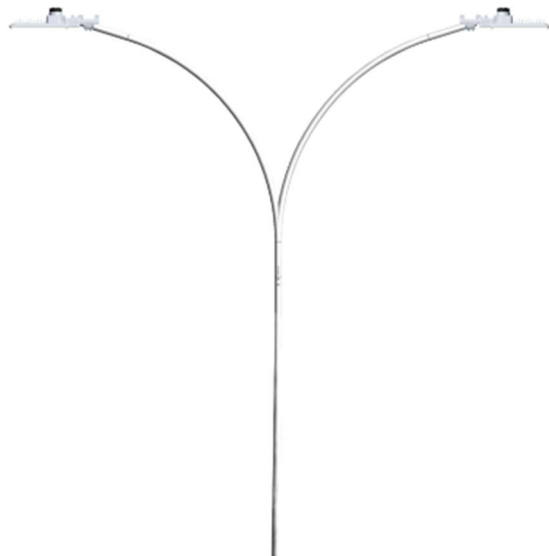
Modelo de Poste Cônico Curvo Duplo a ser instalado na praça

Poste Cônico Contínuo Curvo Duplo é fabricado em aço estrutural SAE 1010/1020, dobrado em prensa em formato de cone com solda longitudinal por processo automatizado.